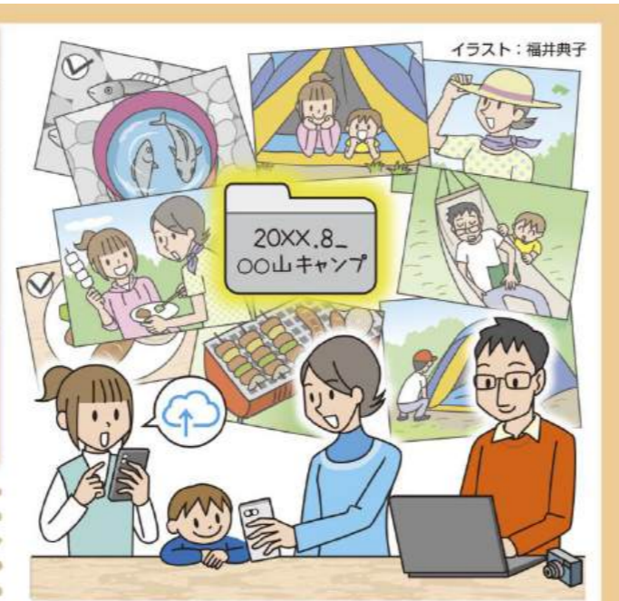
イラスト：福井典子

写真データを整理するコツ 写真がフィルムからデジタルに変わり、さらにスマホが普及してからは、一層、撮影する機会が増えています。デジタルなので写真が増えても家の中が散らかるようなことはありませんが、データも整理整頓していかないと追いつかなくなってきます。古い写真は記憶が薄れがちなので、取りかかりやすい最近の写真から始めてみましょう。 ①データを1か所にまとめる 家族や友人がそれぞれスマホを保有していると、同じシーンの写真を各自撮影しているので、データを1か所にまとめます。データ容量が膨大なので、パソコンを使ったり、オンライン上のクラウドストレージを利用したり、ご自身に合った方法を調べてみましょう。 ②フォルダごとに分類する 年や月、イベントなど、ご自身で把握しやすいようにフォルダに分類します。年ごとのフォルダを作成し、その中に「2024.5_運動会」「2024.8_家族旅行」など