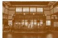
「出雲大社前駅」/島根県

ネオルネサンス様式の駅舎は平成8年には国の登録有形文化財に指定されました。ホームの屋根を支える柱の梁には線路レールが使われています。