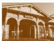
「浜寺公園駅」/南海本線

1897(明治30)年に開業し、10年後の1907年に辰野片岡事務所の設計で建て替えられました。現在、平屋の木造建築で鉄板葺き、外観は木組みを装飾模様として生かしている。非常に希少性のある建物で、日本の近代建築として高く評価されてきた。1998年、国の登録有形文化財に登録されました。